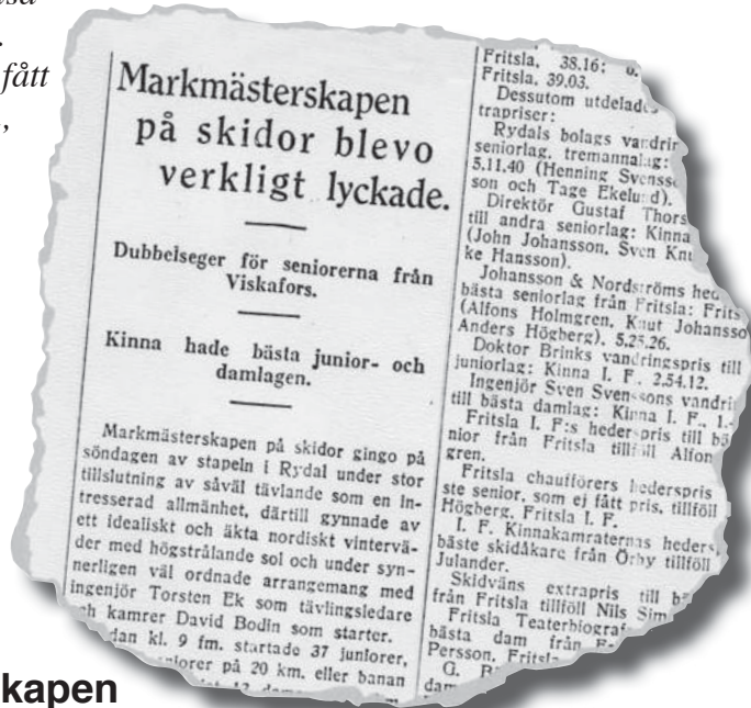
Ur Borås Tidning 24 februari 1929

De tävlande deltog med piggt humör och utan minsta missöden i tävlingarna och framme vid målet hade de endast att gå direkt till badet eller duschen i Rydals