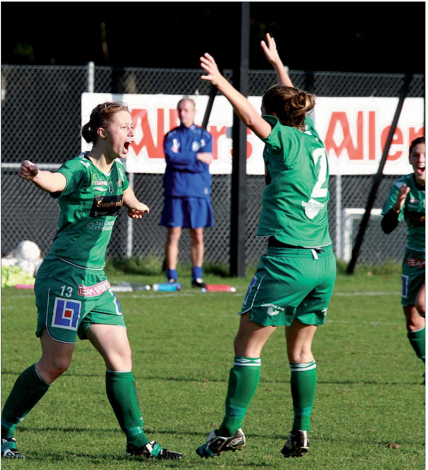
Dalsjöfors Golf's damlag går upp i Allsvenskan