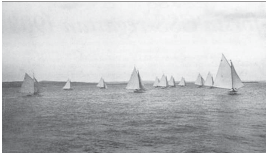
En av de första segeltävlingarna som CSS anordnade, kanske rent av den allra första som ägde rum midsommardagen 1909.

Det var ofta omvittnat att nästan alla förhållanden då var olika dem vi nu upplever. När det gällde segling och båtar var det annat än den enkla vättersnipan och allmogebåten sällsynta på Vättern. Det fanns dock redan etablerade segelsällskap i Vadstena, Motala, Jönköping och Askersund där det fanns båtar av annat slag. Det var ofta kostrar, lite klumpiga och tröga med besvärliga segel, långa bommar och gafflar, kanske två till tre försegel på ett nästan lika långt peke som båten och kanske till och med toppsegel. Men grant var det att se dessa båtar under segel.