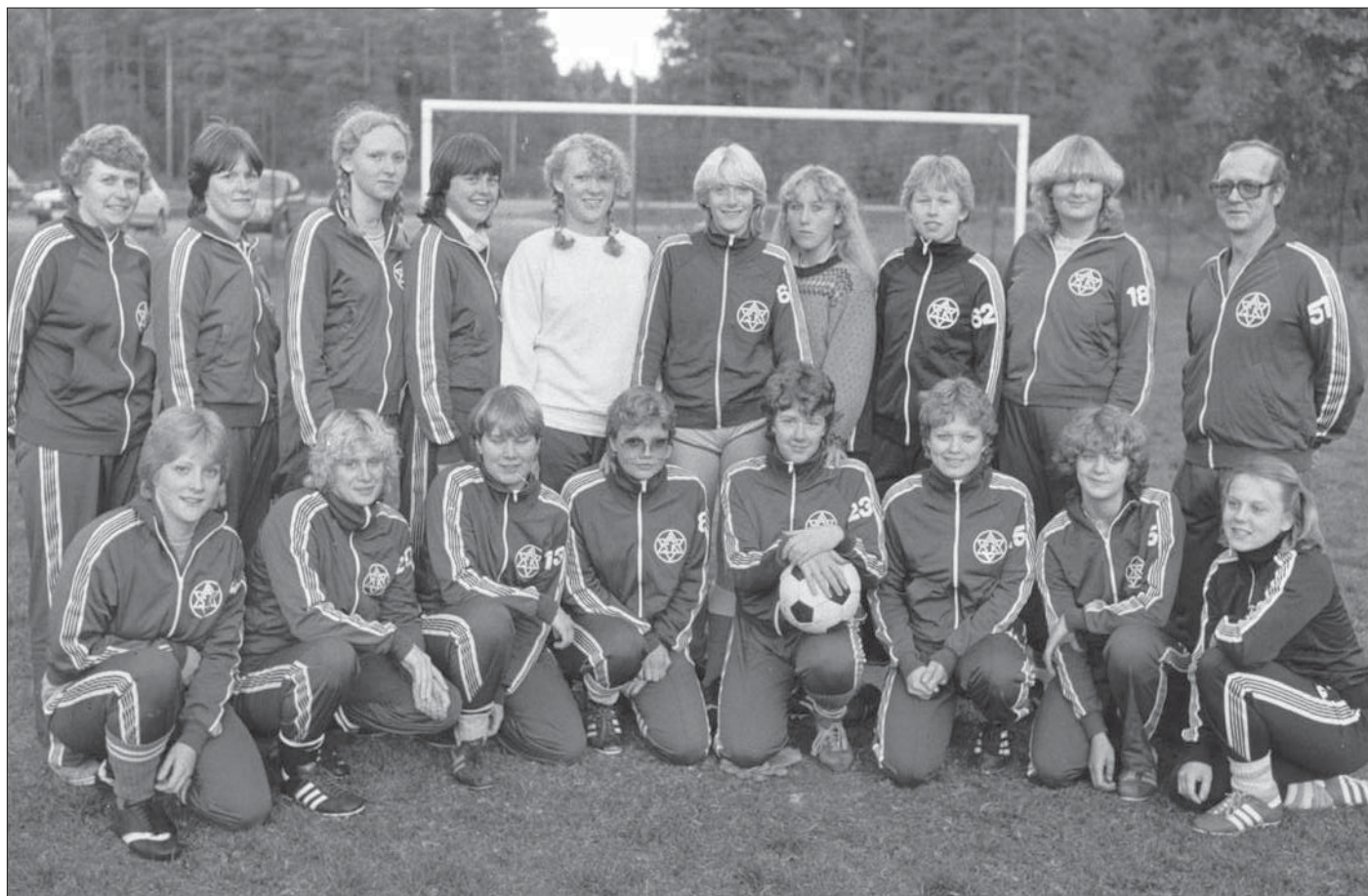
1981 års suveräna seriesegrare, Åsaka SK:

Genom att klubben fick sin fina anläggning ökade också ungdomsverksamheten och klubben hade många lag i gång i olika åldersgrupper. Samtidigt fick motionssektionen en verklig fart och hade många olika aktiviteter igång. Inför 50-årsjubileumet 1990 anmäldes femtio medlemmar till populära löpartävlingen