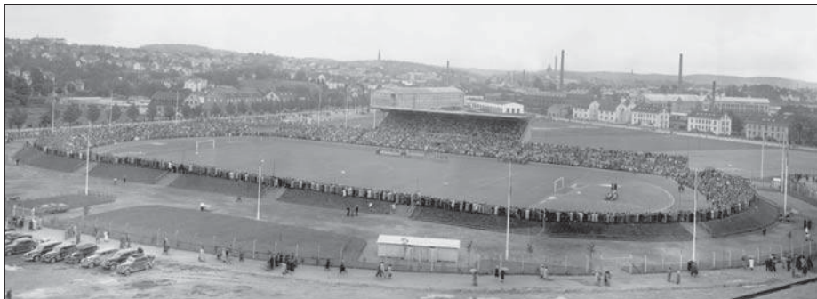
Ryavallen, vid invigningen 1941

Det danska laget var det första utländska som uppträtt på Ryavallen, invigd i augusti 1941 under pågående världskrig. Kriget försvårade naturligtvis allt fredligt internationellt umgänge, också på idrottens område.