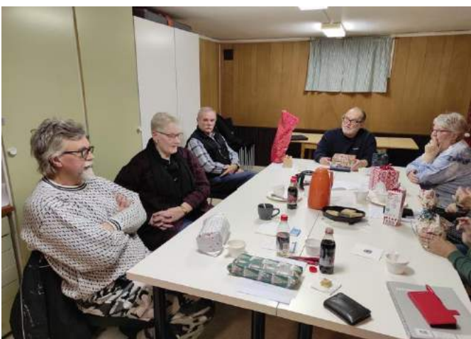
Styrelsemöte december 2021.

I föreningen har vi ca 90 medlemmar. Vi hyr en lokal av en HSB-förening där vi har våra styrelsemöten och när vi har medlemmöten med aktiviteter så huserar vi i Disponentvillan där vi också har tillgång till kök.