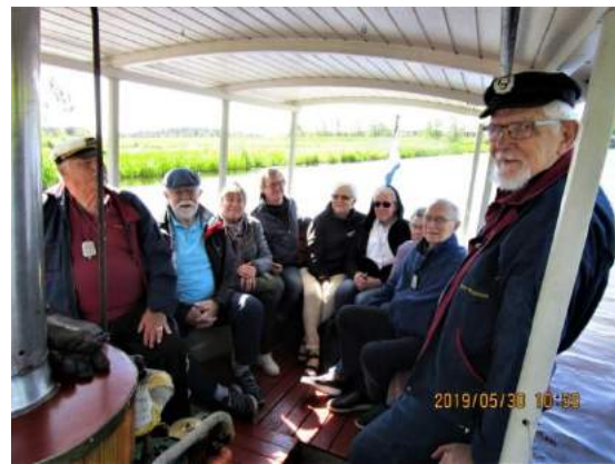
Ångbåtstur med HRF Falköping.

mål, eller att du vill bidra med dig själv, är du hjärtligt välkommen att höra av dig till någon i styrelsen.