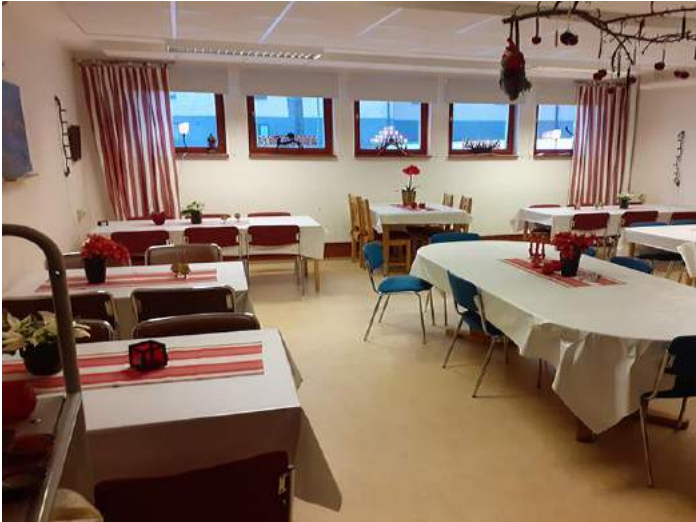
Bild på lokalen 2021.

Vi ligger i startgrupparna för att utveckla vår verksamhet.