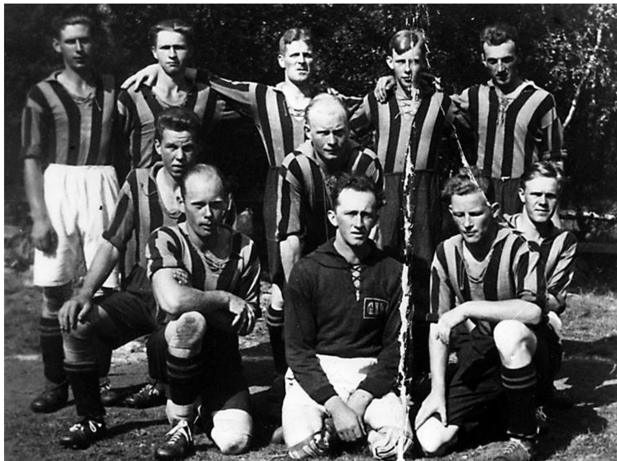
Grolanda IK på 30-talet