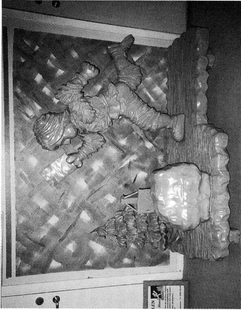
Symbolen från orienterings-VM i Skaraborg 1989 välkomnar besökarna till idrotts- museerna.